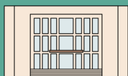
DOM KULTÚRY PARTIZÁNSKE